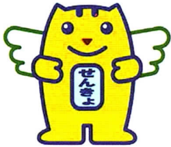
選挙のめいすいくん

全国で約6万5千人、さいたま市では約1,100人の方が参加している民間の団体です。自主的に参加された方、自治会から推薦された方、学職経験者、青年団体の代表者、報道関係者などが参加し、選挙管理委員会と協力して、明るい選挙推進運動を実施しています。