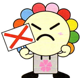
さいたま市選挙キャラクター みらいくん